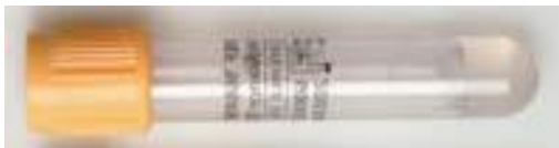
Rör vakuum 5 mL, guldgul propp, koag.akt. SST-gel, drar 3,5 mL (Artnr: 3197)

Om möjligt, centrifugera (G-tal 2000, 10 min) inom 2 timmar.